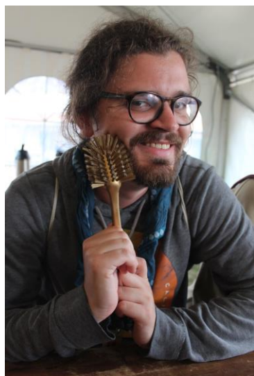
LuWu – Meister der goldenen Bürste